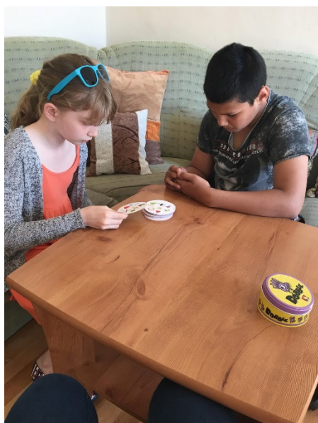
Doučování žáků v doučovacím klubu – trénink pozornosti