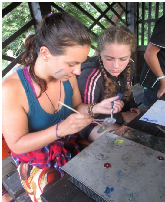
Volnočasová aktivita – Pobyt Ostravice - tvorba smaltování (rukodělná aktivita)