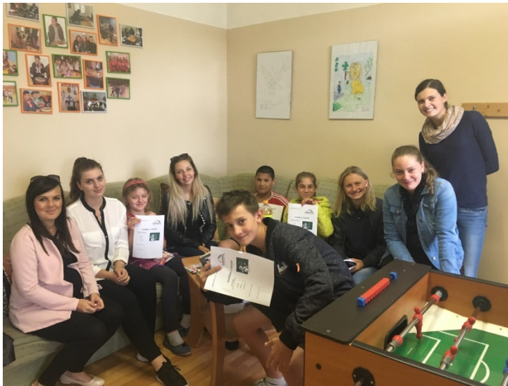
Závěrečné rozloučení v doučovacím klubu EUROTOPIA.CZ