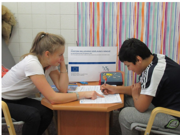
Doučování žáků 4. a 5. třídy v doučovacím klubu EUROTOPIA.CZ