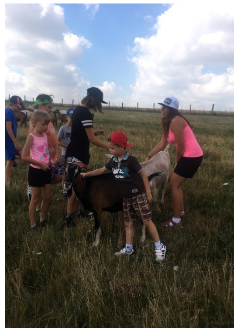
Volnočasová aktivita – příměstský tábor – environmentální výchova