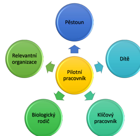
Schéma pozice pilotního pracovníka projektu