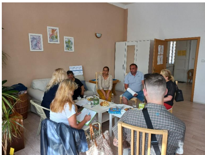
Účast rodičů doučovaných žáků na platformě.